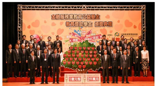
▲ 馬總統及曾主委與捐助單位合照

金管會曾主委表示，教育是翻轉人生最重要的管道，感謝金融總會對於本計畫的用心規劃，也感謝所有捐助的金融周邊單位、金融同業公會、金控公司及銀行等機構共同發揮愛心，善盡企業社會責任，並期勉金融業取之於社